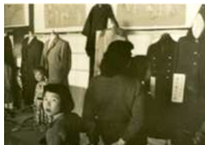
①昭和24年文化祭 戦後間もなく物資が少なかった時代だったので、文化的な生活を営むために地元の流し台などの工業製品や被服・繊維製品が展示されていました。

この度、その成果物として、約17,000枚もの写真データをご提供いただきました。本号より、デジタル化した写真を披露する場として、少しずつではありますが、紙面でその写真を掲載していきたいと思ひます。どうぞお楽しみください。