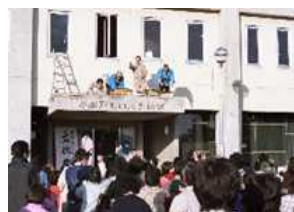
②昭和59年文化祭 公民館の駐車場では、野菜の販売があったり、玄関の底の上からは「餅撒き」が行われていました。