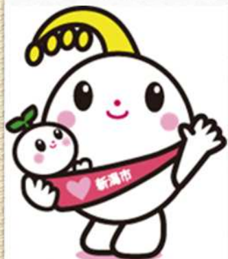
新潟市子育て応援キャラクター ほのわちゃん