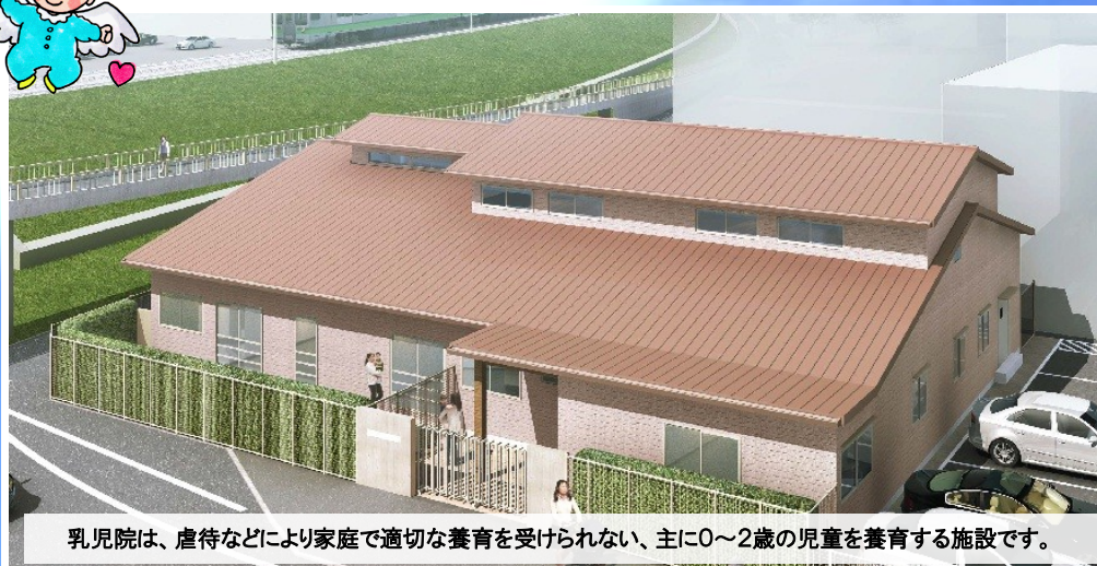
乳児院は、虐待などにより家庭で適切な養育を受けられない、主に0～2歳の児童を養育する施設です。

新潟市が平成27年4月1日開設に向け整備を進めている、「新潟市立乳児院」の愛称を募集します。