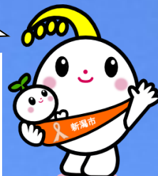
新潟市子育て応援キャラクター ほのわちゃん