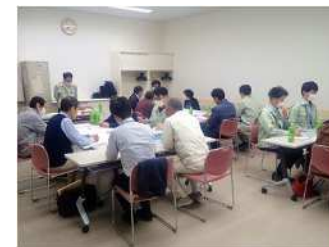
ワークショップの様子

令和5年10月31日に立仏校区ふれあい協議会様のご協力もいただきながら、黒崎市民会館にて行ったワークショップの結果をまとめ、今後の方針を記載したニュースレターを作成しました。