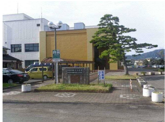
写真 6-49 巻文化会館