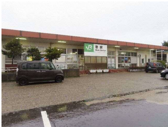
写真 6-48 JR 巻駅