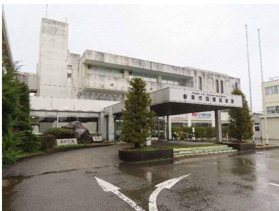
写真 6-50 西蒲区役所