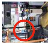
定期券専用カードリーダー

通勤・通学ラッシュ時間帯（平日ダイヤ運行日の朝7時から9時まで）は「リ्यूー」と定期券専用カードリーダーが使用できます。 ※定期券乗り越し区間がある場合は、（運転席側）カードリーダーをタッチしてください。