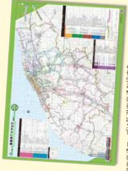
新潟市交通マップは新潟市交通お役立ちサイトからダウンロードできます。