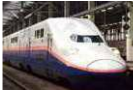
(新 潟 ~ 東 京)

新 潟 駅 から 東 京 駅 ま で 約 2 時 間 で 移 動 で き ま す 。 2 階 建 て の “Max と き 号” も 走 っ て い ま す 。 新 潟 県 内 に 5 カ 所 の 駅 が あ り 、 県 内 の 移 動 や 通 勤 な ど で 利 用 さ れ て い ま す 。 乗 車 す る 新 幹 線 の 「指 定 席」 を 事 前 に 予 約 し て お け ば 、 混 雑 時 に も 席 を 確 保 す る こ と が で き ま す (指 定 席 は 別 途 料 金 が 必 要 で す)。