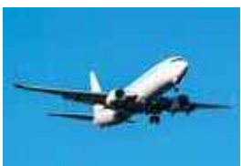
国 内 線 : 札 幌 (新 千 歳) / 成 田 / 名 古 屋 (中 部 国 際 ・ 小 牧) / 大 阪 (伊 丹) / 福 岡 / 沖 縄 (那 覇) 国 際 線 : ソ ウ ル / 上 海 / ハ ル 濱 仁 / 台 北

新 潟 空 港 を 発 着 す る 飛 行 機 は 、 国 内 の 主 要 都 市 を は じ め 国 外 の 様 々 な 都 市 と 新 潟 を 結 び 、 市 外 の 方 か ら も 旅 行 や ビジネスなどに利用されています。新 潟 駅 から 新 潟 空 港 へ の ア ク セ ス は リ ム ジ ン バ ス で 約 25 分 、 最 寄 り の 高 速 道 路 IC か ら は 約 10 分 と 利 便 性 の 高 い 場 所 に 位 置 し て い ま す 。