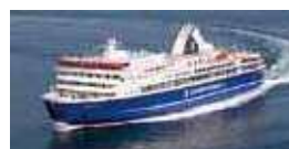
(新 潟 ~ 佐 渡)