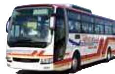
(新 潟 駅 南 口 ~ 新 潟 空 港)

こ の バ ス に 乗 れ ば 、 新 潟 駅 と 新 潟 空 港 間 を ノ ン ス ト ッ プ で 移 動 で き ま す 。 ゆ と り の あ る 座 席 配 置 や バ ゲ ッ ジ ルーム を 備 え て い る た め 、 海 外 旅 行 な ど 大 き な スー ツ ケ ー ス を 持 っ た 方 も 利 用 し や す い バ ス で す 。 所 要 時 間 は 片 道 約 25 分 、 1 日 往 復 65 便 が 走 っ て い ま す 。