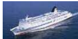
(新 潟 ~ 小 樽 / 苫 小 牧 / 敦 賀 / 秋 田)

2019 年 で 開 港 150 周 年 の 新 潟 港 か ら は 、 佐 渡 航 路 の ほ か 、 北 海 道 や 福 井 県 等 を 結 ぶ 航 路 が 就 航 し て い ま す 。 フェリーの中には船内にビデオシアターやカラオケボックス、大浴場などを備えているものもあり、長時間の移動でも快適に過ごすことができます。