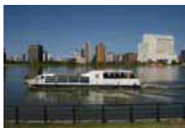
(新 潟 ぶ る さ と 村 ~ 新 潟 県 庁 ~ 朱 鷲 メ ッ セ ~ み な と び あ)

新 潟 市 を 流 れ る 大 河 ・ 信 濃 川 を 周 航 す る 水 上 バ ス 。 四 季 折 々 の 河 畔 の 風 景 を 眺 め な が ら 、 観 光 ス ポ ッ ト ま で 水 上 の 旅 が 楽 し め ま す 。 移 動 用 の 「シャトル便」のほかに、観光に利用される「周遊便」や貸切の「チャーター便」などがあり、イベントや船上結婚式などの利用もできます。