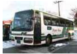
(新 潟 ~ 三 条 ・ 燕 / 五 泉 ・ 村 松 / 長 岡 / 柏 崎 / 十 日 町 / 高 田 ・ 直 江 津 / 糸 魚 川)

高 速 道 路 を 通 る こ と で 、 短 時 間 で 新 潟 市 と 県 内 各 地 を 結 ぶ バ ス で す 。 予 約 な し で 利 用 で き る の で 、 急 な 予 定 の 際 に も 乗 る こ と が で き て 便 利 。 長 距 離 の 移 動 で も 、 睡 眠 や 読 書 な ど し て 過 ご せ る メ リ ッ ト も あ り ま す 。