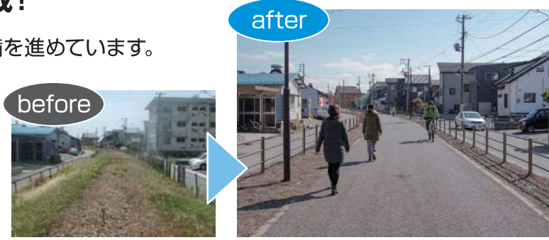
電鉄跡地・歩行者自転車道(市道西5-270号線)