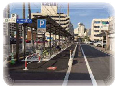
八千代自転車駐輪場

環境問題や健康志向の高まりなどから全国的に自転車の利用が見直されてきたことを受け、「新潟市自転車利用環境計画」を策定しました。また「新潟市公共交通及び自転車で移動しやすく快適に歩けるまちづくり条例」も策定し、計画に基づき、自転車の駐輪場や走行空間など、自転車利用環境の整備を進めています。