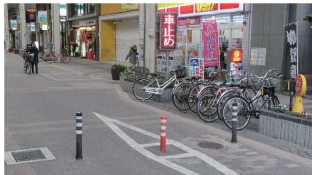
ライジングボラード(ふるまちモール6)