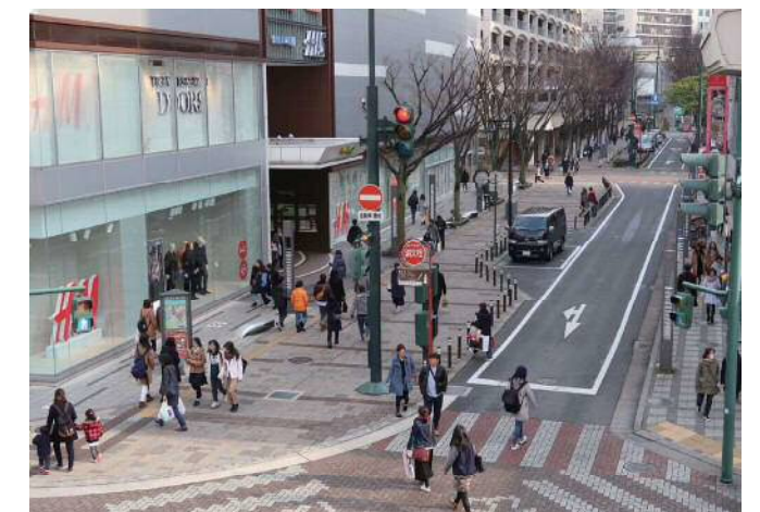
ガルベストーン通り