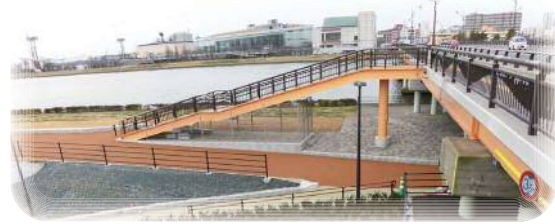
やすらぎ堤・階段(一般県道白山停車場女池線)