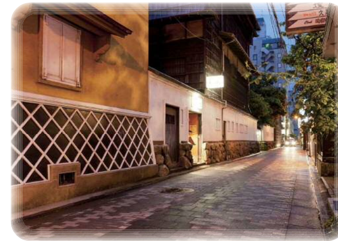
鍋茶屋通り