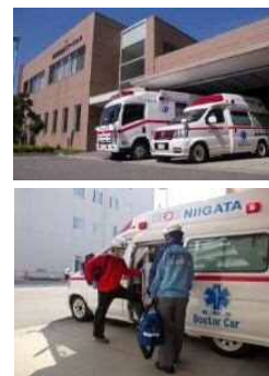
写真：救急ステーションとドクターカー