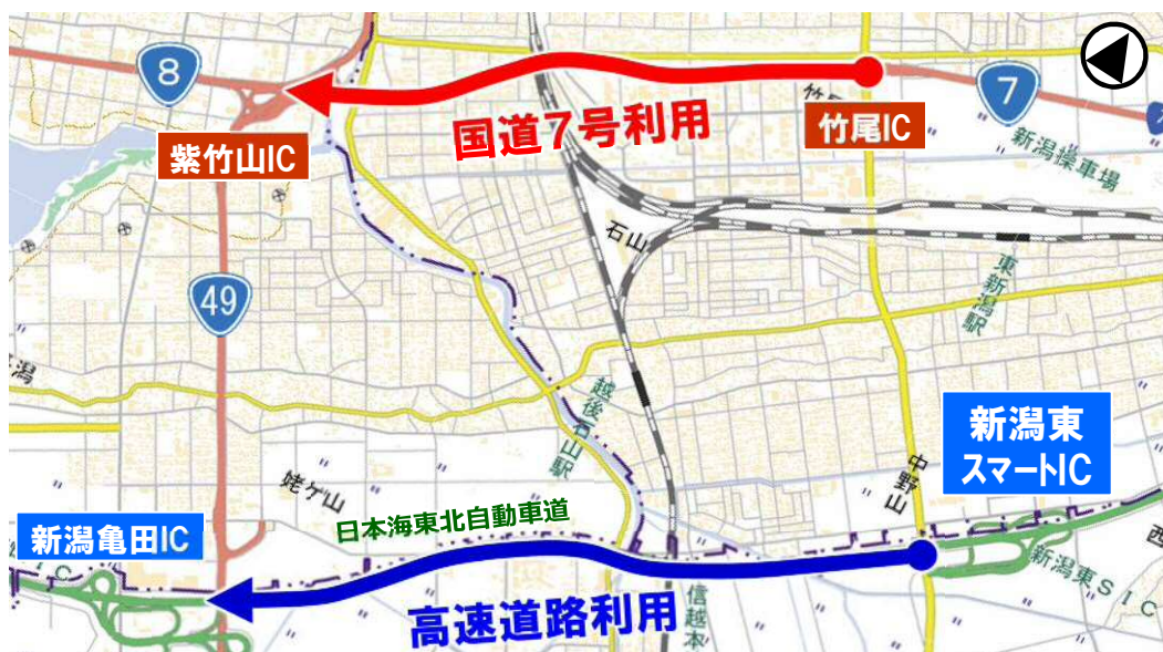
* 国土地理院の電子地形図（タイル）に路線番号等を追記して掲載

朝夕ピーク時の交通集中によって、国道7号の走行速度が10～70km/hの間でバラつきが見られるのに対し、高速道路の走行速度は概ね80km/h以上で安定しています。