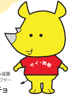
新潟市ごみ減量 推進キャラクター サイチヨ