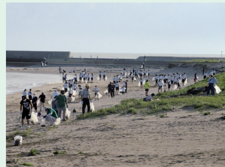
地域清掃活動の様子