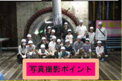
写真撮影ポイント