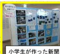
小学生が作った新聞