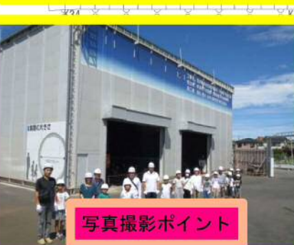
写真撮影ポイント