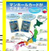
マンホールカードが できました！