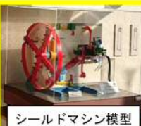
シールドマシン模型