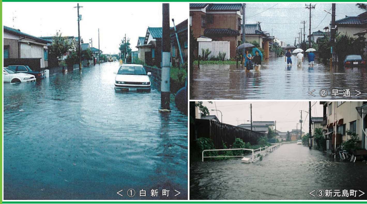
「①平成10年8月4日浸水状況 ③平成18年7月13日浸水状況」

この浸水ハザードマップは、市内で記録された過去最大の大雨が降った時の浸水状況などを示したものです。河川の堤防の決壊などによる洪水の場合は、「洪水ひなん地図」(平成18年3月)や「北区あんしんガイドブック」(平成28年4月)を参考にしてください。