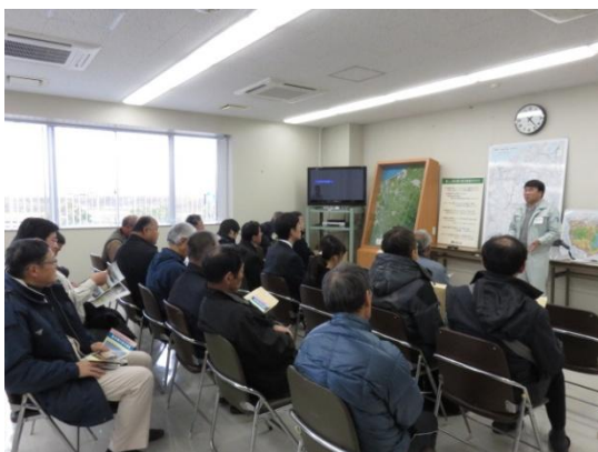
新井郷川排水機場で説明を受ける