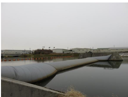
福島潟放水路の豊栄潮止堰