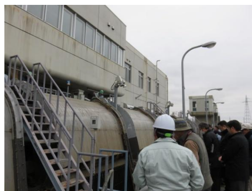
新井郷川排水機場の除塵機を見学