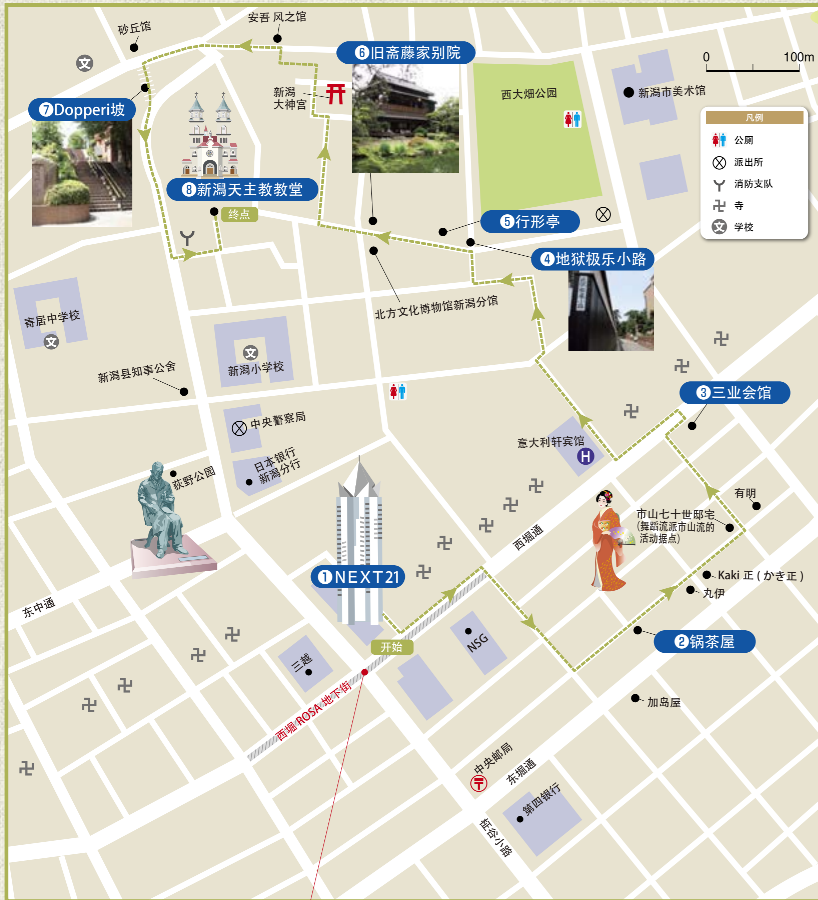
— 友谊广场（会合いの広場）：西堀 ROSA 为适合见面碰头的好地方。（西堀通的地下广场）