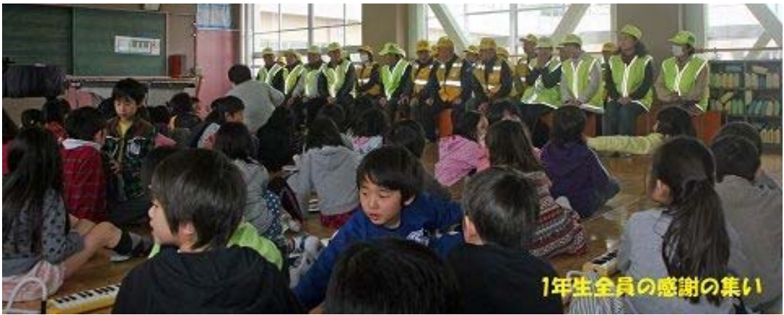
パトロール隊感謝の集い