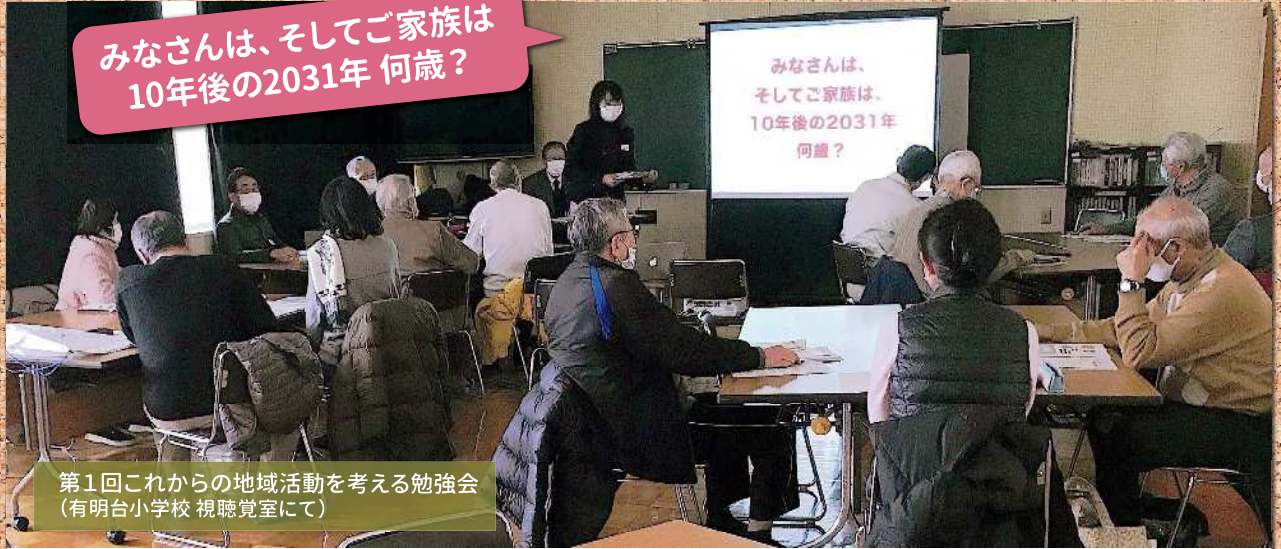
第1回これからの地域活動を考える勉強会 (有明台小学校 視聴覚室にて)