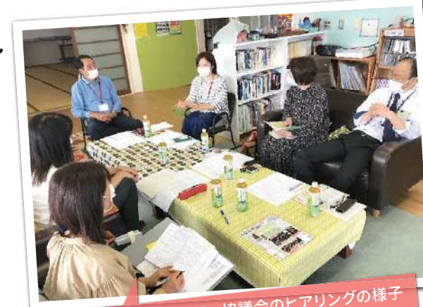
庄瀬地域コミュニティ協議会のヒアリングの様子

令和3年度は、コミ協の立地環境や人口規模などから8コミ協を選定し、活動についてのヒアリングと専門家によるアドバイスを実施。状況ごとに類型化し、活動の見直しのポイントや手順を明らかにします。事例集にまとめ、全市対象のフォーラムでも共有する予定です。(3月予定) 社会の変化や住民ニーズに応える活動に転換し、携わる人の負担軽減と次世代へ受け継ぐことを目指します。