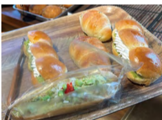
どれにしようか迷ってしまいました♪