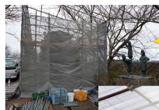
大規模補修工事の様子

現在、車両は作業足場に囲われた状態で作業現場になる駅構内も入ることができません。作業は7月末までには終了する予定です。よりきれいになったかぼちゃ電車を今から楽しみにしててください。