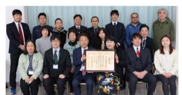
受賞おめでとうございます

1月23日、令和6年度の学びと成果を白根学習館で発表した白根高校生。たくさんの地域の人たちと関わりながら「コミュニケーション力」を身に付け、地域で活躍する人を紹介する「仕事人の図鑑」の作製や、地域の祭りを盛り上げる方法などの課題に、地域と一緒に取り組みました。