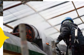
3/11ラッセル車の屋根部分を洗浄中!