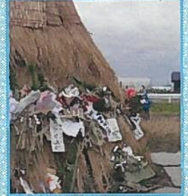
年男・年女による点火で 祈りを込めて…