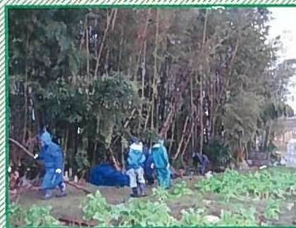
雨の中、竹の切り出しは大変です。