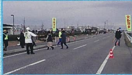
関係者の皆様 お疲れ様でした。