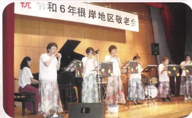
オカリナ・かぶえテラス