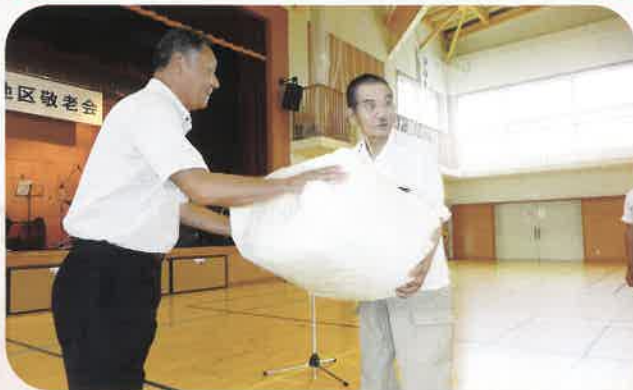
記念品贈呈 85歳 4名