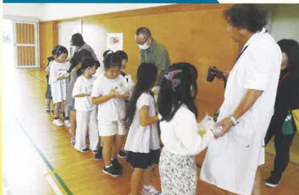
アルファ米を食べてね