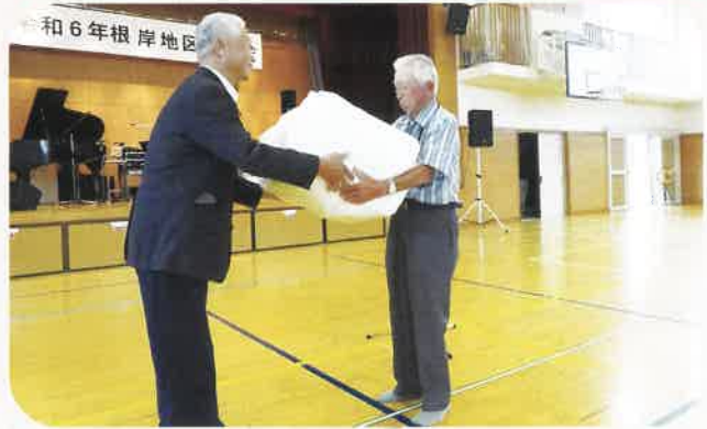
記念品贈呈 90歳 2名