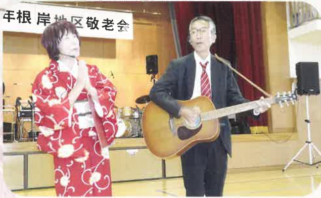
夫婦漫才 つまようじ