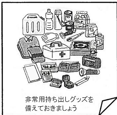
非常用持ち出しグッズを 備えておきましょう

けてまいりました。いうまでもなくこうした活動は来年度以降も継続していかなければなりません。活動の成果を検証し、来年度は一步でも進んだ取り組みをめざしていきます。災害など起こらず 防災の取り組みが杞憂に終わればそれに越したことはありません。でも私たちは万が一を想定し 安心・安全のためにやるべきことを来年度も取り組みます。