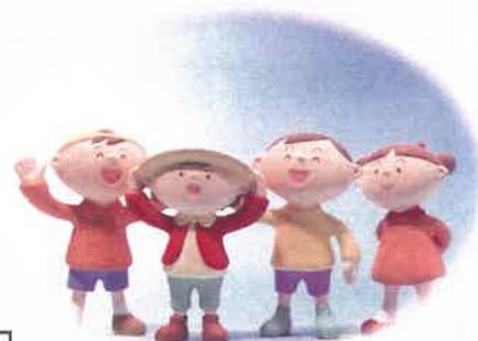
令和3年度 臼井地区 自主防災会委員の皆様