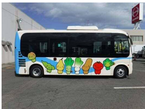
南区ラッピングバス