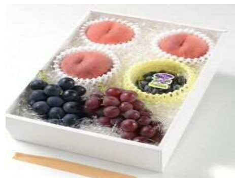
フルーツ詰合せイメージ