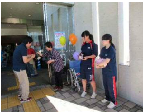
【白根高校ボランティア部・野球部】 南区健康福祉フェア 募金活動、前日準備協力