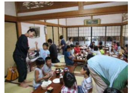
【ふおうはーと】 夏休みイベント お寺で遊ぼう

南区ではたくさんの ボランティアの皆様 が活動されています。 一部をご紹介します。