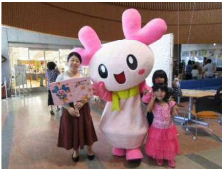
【白根ローターアクト】 南区健康福祉フェア イベント協力