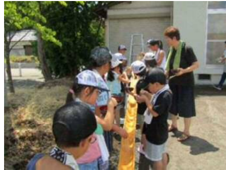
【吉江生き生きの会(地域の茶の間)】 そうめん流し 世代間交流