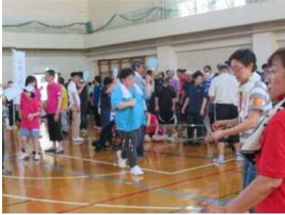
【個人・団体ボランティア、民生委員】 南区障がい者スポーツ大会運営協力