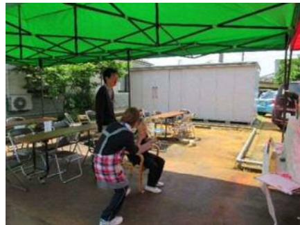
【南区あやめの会】 施設のおまつり補助