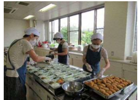
【月湯南天の会】 一人暮らし高齢者への 給食サービス(調理～配食)