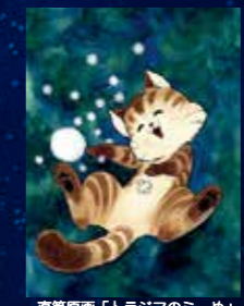
直筆原画「トラジマのミーめ」