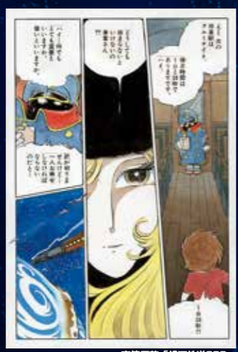
直筆原稿「銀河鉄道999」

1977年に「少年キング」で連載が始まり、1978年テレビアニメ化以降、劇場アニメも多く公開され人気を博した松本の記念碑的作品で今年は誕生40周年の記念の年にあたる。銀河系の惑星たちが銀河鉄道で結ばれた未来世界の宇宙が舞台。機械の体を手に入れるため「アンドロメダ」を目指す少年・星野鉄郎と謎多き美女・メーテルの冒険が描かれる。「銀河鉄道999」が停車する場所での出会いや出来事が鉄郎を次第に成長させていく。