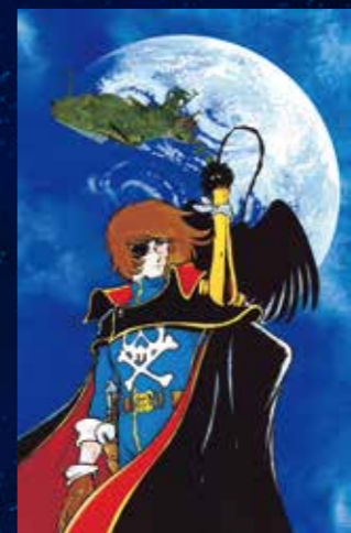
「永遠のアルカディア」

1977年にプレイコミックで漫画連載が始まり、1978年からアニメ放映が始まった。西暦2977年、地球に侵略をはじめた異星人マゾーンと宇宙海賊として自身の信念に基づき命を懸けて戦い抜くハーロックの姿が描かれる。ハーロックに窮地を救われた少年・台羽正もアルカディア号に乗り込み、打倒マゾーンを目指す。