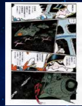
直筆原稿「宇宙戦艦ヤマト」

1974年にアニメ放映がスタート。以降、劇場アニメも公開され国内で一大ブームを巻き起こす。西暦2199年、異星人・ガミラス帝国の攻撃によって甚大な放射能汚染を受けた地球は、滅亡まで1年という危機的状況に陥ってしまう。地球の遥か彼方にある大マゼラン星雲・イスカンダルにある放射能除去装置で地球を救うために戦う、宇宙戦艦ヤマトの艦長・沖田十三はじめ古代進ら乗組員の姿を描く。