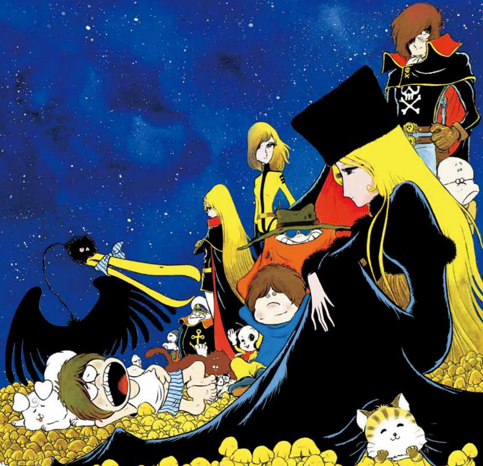
「零士ファミリー」 ©松本零士