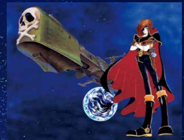
「遙かなるアルカディア」