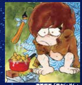
直筆原画「男おいどん」