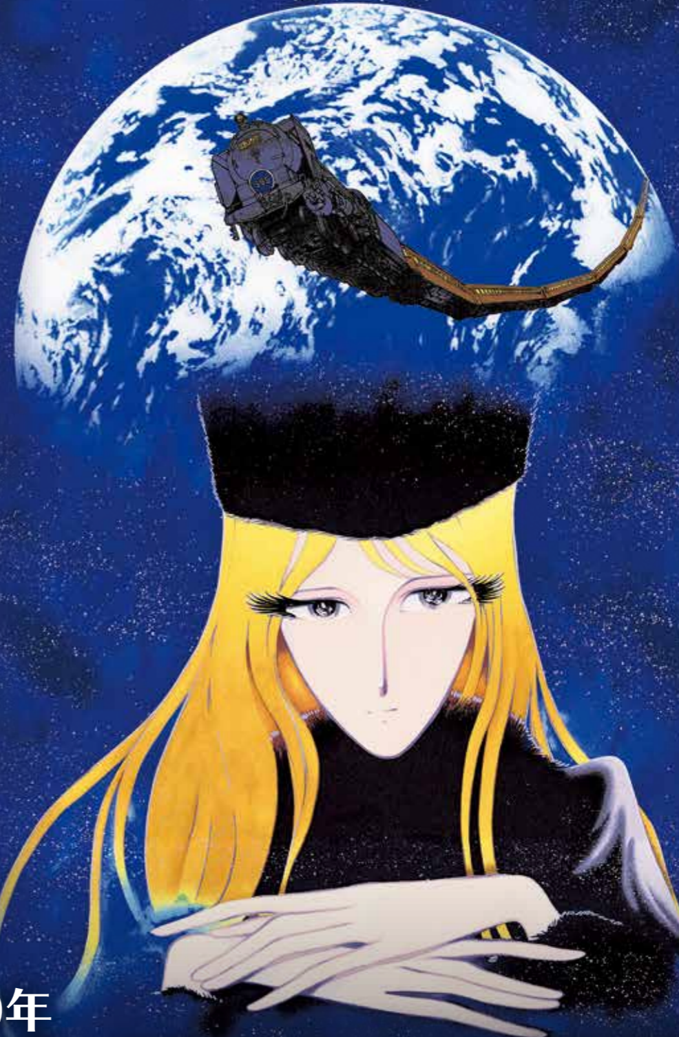
「時の環の接する処」 ©松本零士