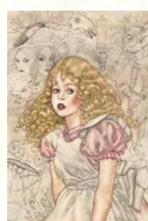
左手から チャールズ・サントーレ『不思議の国のアリス』第5章より 《イモ虫からの忠告》© 2017 Charles Santore ジョン・ヴァーノン・ロード 『鏡の国のアリス』第6章より 《ハンブチ・ダンブチ》©John Vernon Lord ヘレン・オクセンバリー『不思議の国のアリス』第8章より 《ハートの女王様とアリス》©Helen Oxenbury アンヘル・ドミンギス『鏡の国のアリス』第12章より 《わたしを起こしてしまったのね、もう!なんともすてきな夢だったのに!》©Angel Dominguez