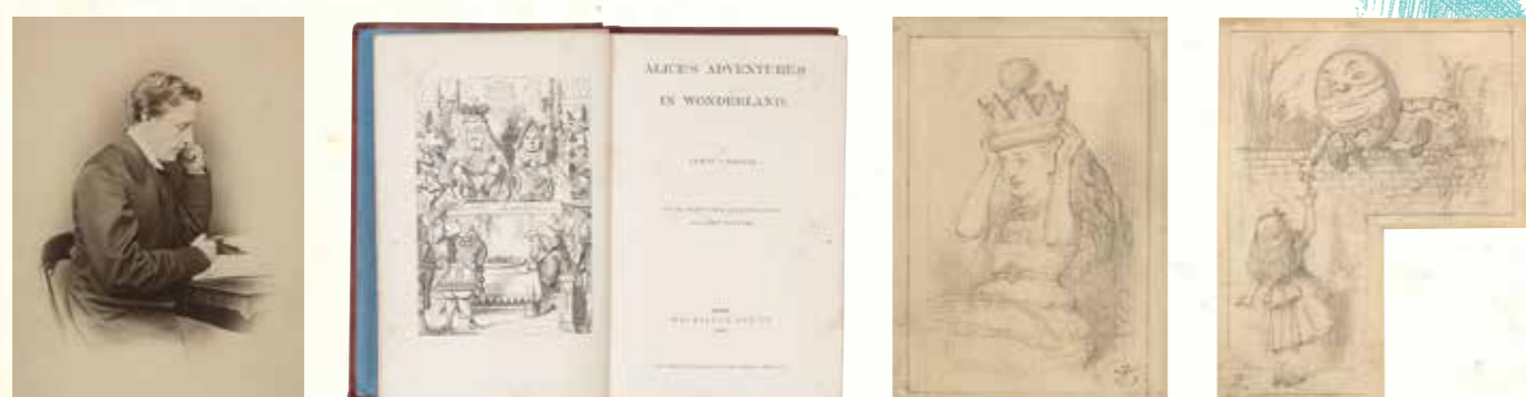
左手から チャールズ・ラトウィッジ・ドッドソン(ルイス・キャロル)の肖像 Charles Lutwidge Dodgson(Lewis Carroll), Self-portrait of Charles Lutwidge Dodgson, 14 March 1874. The Rosenbach, Philadelphia 『不思議の国のアリス』初版刊行本 聖徳大学・聖徳大学短期大学部蔵 ジョン・テニエル『鏡の国のアリス』挿絵のための下絵(アリス女王)John Tenniel, Queen Alice. The Rosenbach, Philadelphia ジョン・テニエル『鏡の国のアリス』挿絵のための下絵(握手してかわさうではないか!)John Tenniel, "You may shake hands!". The Rosenbach, Philadelphia

作者ルイス・キャロル(1832-1898)がオックスフォード大学クライスト・チャーチの数学教師をしていた頃に、少女アリス・リデルと出会ったことから「アリス」の物語が生まれます。挿絵画家ジョン・テニエル直筆の素描やキャロルの肖像など、物語の誕生にまつわる資料をご紹介します。