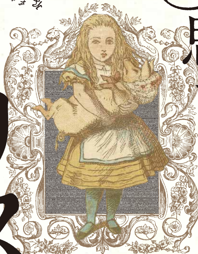
ルイス・キャロル(切手ケース)(部分)1890年 Lewis Carroll, The Wonderland postage stamp case. The Rosenbach, Philadelphia