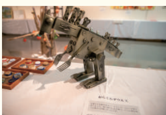
区内小学校の自由研究優秀賞作品

10月26日、27日に西新潟市民会館で「アートフェスティバル+音届(おとどけ)」を行い、多くの人々が来場。今回は初めて新潟大学と共催で実施し、アート作品展示や西区で活動している音楽・芸能団体の発表で、西区の秋を彩りました。