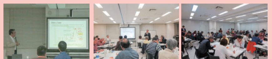
10月23日に行った「地域活動見直しワーク研修」