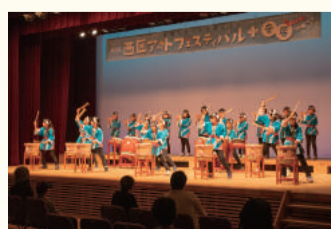
笠木小の樽きめた演奏