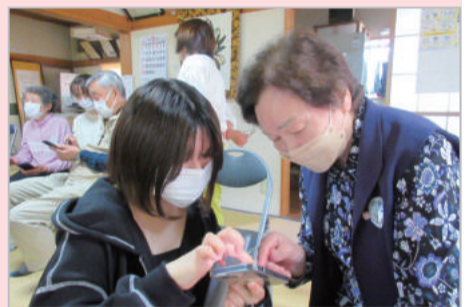
地域のお茶の間でみんな笑顔