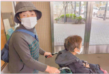
お疲れさまでした さあ、帰ろう