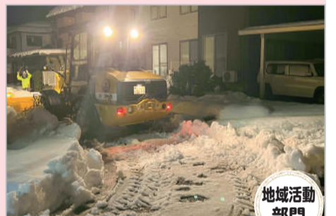
大雪の早朝自治会内除雪