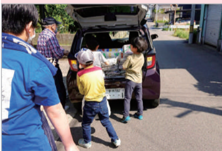
高齢者と子どもの古紙回収