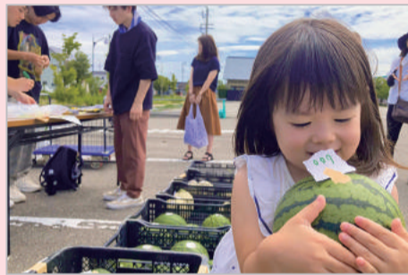
はじめてのおつかい