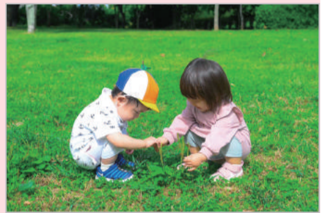
公園でみーつけた!