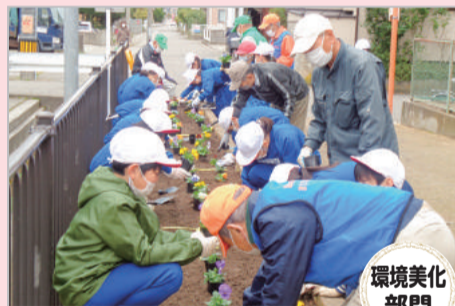
小堀花壇の花植え