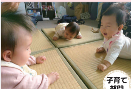
0歳3人の井戸端会議