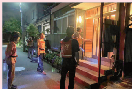
高齢者への声かけパトロール