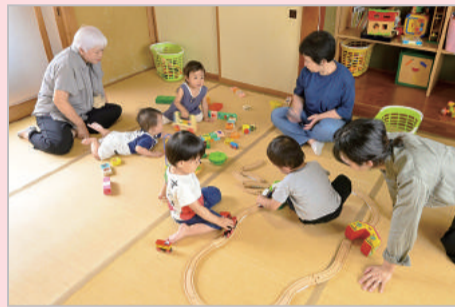
みんなでワイワイ♪