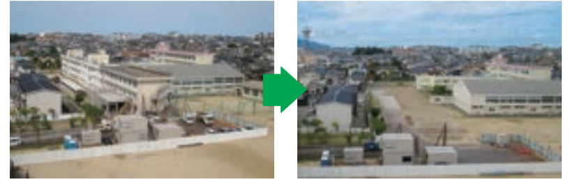
南校舎の解体が完了

ます。今後は、今年度中に仮設校舎を建設し、来年度から全学年がそろって坂井輪中学校で学校活動を再開できるよう復興を進めていきます。