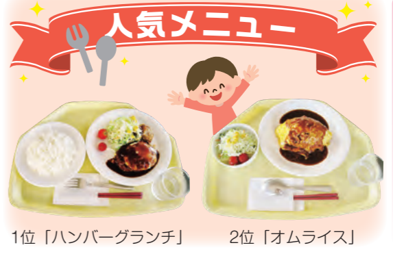
1位「ハンバーグランチ」 2位「オムライス」