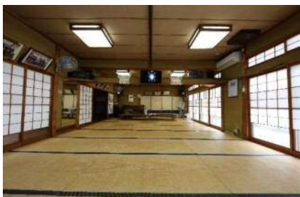
大広間(床の間側から)