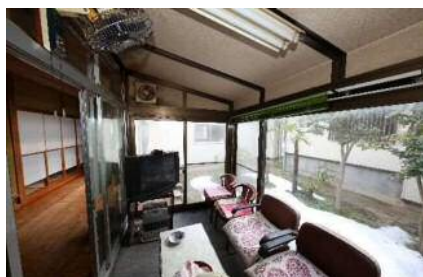
サンルーム(喫煙所)