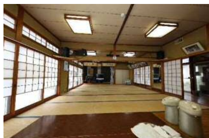
大広間(ワークルーム側から)