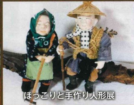
ほっこりと手作り人形展