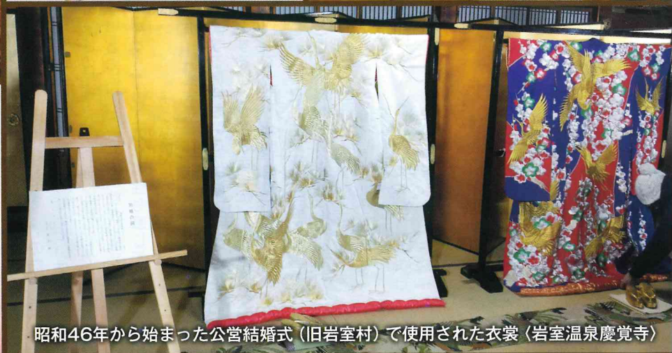
昭和46年から始まった公営結婚式(旧岩室村)で使用された衣裳(岩室温泉慶覚寺)

コロナ禍で先の見えない日々が続きますが、いわむろ温泉街では春を迎える「おひな様」で地域を元気にしたいとひな巡りを開催しています。なお、まん延防止重点措置の適用に伴い、感染症対策を講じた上で取り組んでおります。ご理解とご協力をお願いいたします。