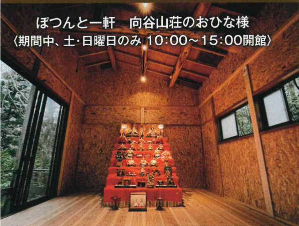
ぼつんと一軒 向谷山荘のおひな様 (期間中、土・日曜日のみ 10:00~15:00開館)