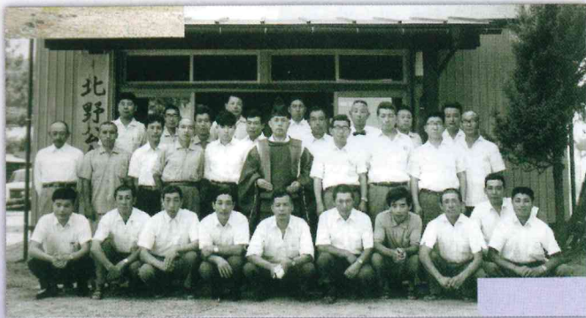
北野公会堂竣工記念〈昭和43年〉— いわむろの記憶 — 参考

野菜の産地としても有名で、昔から促成栽培を実地し、個々で作った野菜を持ち寄り、弥彦や間瀬、遠くは野積あたりまで売り歩いたそうです。今でこそ珍しくありませんが、その当時から共同販売を行っていたわけです。このように昔から集落内のつながりが深かった北野ですが、これからはこのまとまりの良さを受け継いで行きたいと思えます。