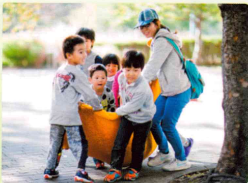
毛布で担架を作って運ぼう!