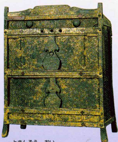
ときんそう おい ◎鑄金装「笈」【青龍寺所蔵】

全体を覆う金銅鑄金装の打ち出し文様、毛彫り文様は豪華でその技法などから室町末期から桃山時代の制作と考えられる。当時の信仰や工芸のあり方を示す文化財として重要であり、桃山の絢爛たる文化と山岳仏教の融合を物語る遺物として中世の修験者法具を今に伝えている。