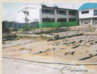
体育館建設工事からの 発掘現場

平成二十二年(二〇一〇)、今井に位置する当時の南 小学校体育館建設工事の時に、古い遺物が発見されまし た。新潟市埋蔵文化財センターが発掘の結果、奈良・平 安時代(今から約一三〇〇年〜一〇〇〇年前)の遺跡で あることがわかりました。出土した遺物は土器の他に漁 撈(ぎょうらう)の際に使うおもり、役人がベルトに付ける帯 飾りなど多岐にわたりました。土器は「館」「川合」と 記されたものがあり、また掘立柱建物や井戸の跡も見つ かったことから、何らかの施設ではないかと考えられて いるようです。遺跡は「林付遺跡」と名付けられました。