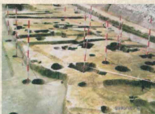
平安時代の掘立柱建物跡

潟東の歴史について、今までは江戸時代に入る前頃に 現在の、西川、大通川、中ノ口川などの流路が固定した とされる室町時代終わり頃から人々が移住してしまっ たと考えられてきました。そのことが林付遺跡により一 挙に約七〇〇年も前にさかのぼることになり、まさに潟 東の歴史の新たな発見です。古代の潟東地域は劣悪な湿 地帯だけではなく、新潟市内では珍しい役人のベルトの 出土や建物跡から公的な施設があり、早くから開けてい たところもあつたことが判ります。