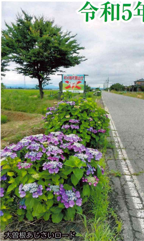
大曽根あじさいロード