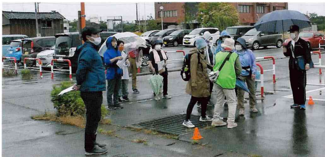
渦東地区公民館・環境福祉保健部会