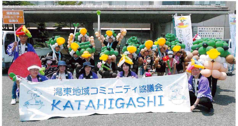
渦東地区青少年育成協議会、フリーダム新潟の皆様

東京ディズニーリゾート®R40周年スペシャルパレードに先立って親カモたちが先導する中、カモねぎの歌に乗って元気いっぱい子カモたちがネギを振りながら渦東をアピール!途中音楽が止まってしまうアクシデントもありましたが、カモねぎの歌もバルーンカモも大人気でした。手拍子と握手で迎えてくれた沿道の人たちがとっても温かかった。どうもありがとう!感謝です。