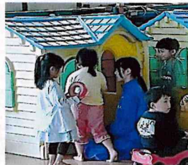
かたひがし保育園

キャリア教育の一環として、2年生対象の職場体験を実施しました。潟東地区をはじめ、白根地区、西川地区、巻地区と22件の事業所から受け入れをして頂きました。生徒は、2日間の体験を通して、働くことの厳しさと喜びを学びました。