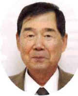
巻地区コミュニティ協議会