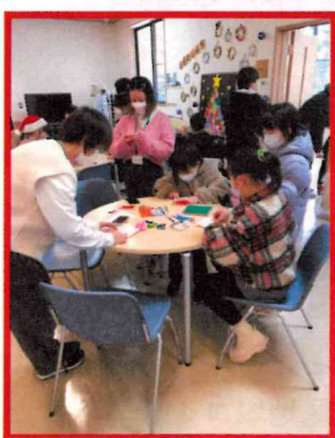
クリスマス飾りづくり