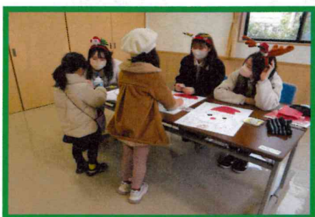
サンタさん福笑い

12月18日(日) 子ども部会のクリスマス会が開かれました。今年も新潟大学「いろはの風」が中心となって企画されました。昨年と同様にコロナ対策として密を避けるため全体での活動を取り止めて、受付時間に幅を持たせグループでの活動にしました。今年もサンタクロースのほかに何故か牛も登場し会場を盛り上げてくれました。「いろは絆バック」活動で作成したリースをコミセンギャラリーで学年ごとに展示しました。