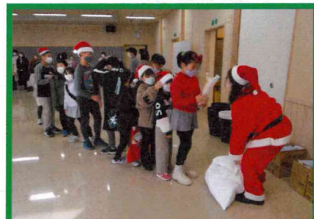
プレゼントをもらいました