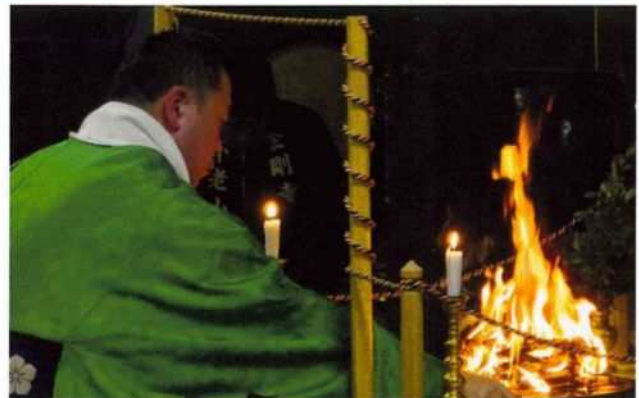
▲金剛寺の星まつり(2月3日)

■西川地域の総人口:10,242名(-45名) ■男:4,957名(-22名) ■女:5,285名(-23名) ■世帯数:4,095戸(-2戸)