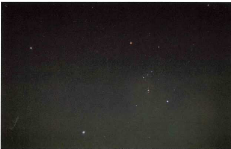
オリオン座と冬の大三角形