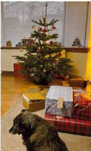
家庭でのクリスマスの様子

私の職場でも、10月からクリスマス・ディナーの企画が始まりました。4月から働き始めま