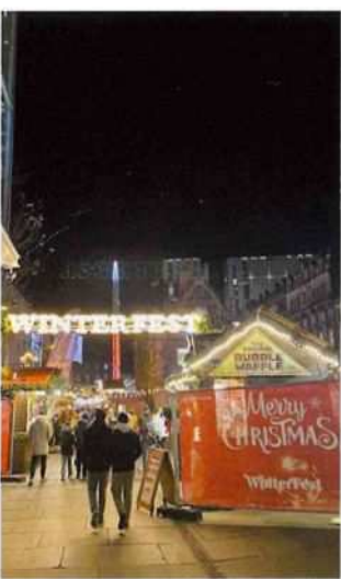
クリスマス飾りのグラスゴウの街