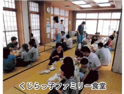
くじらっ子ファミリー食堂

◇漆山地域の人口：3,219人（男：1,560人 女：1,659人）◇世帯数：1,201世帯（令和 7 年 1 月末現在）