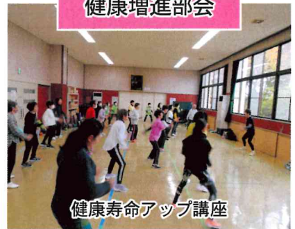
健康寿命アップ講座