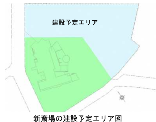
新斎場の建設予定エリア図