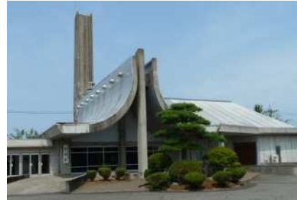
現在の巻斎場施設

基本構想 新潟市巻斎場（以下、「斎場」という。）は、昭和43年の開設から55年が経過し、これまで火葬炉や施設の増設工事は実施しましたが、大規模改修は行っておらず、火葬炉、建物ともに老朽化が進んでいます。また、高齢化の進行により、増加が見込まれる火葬需要への対応が困難になることが想定されるため、現敷地内での建替えにより、必要な火葬体制の確保及び市民サービスの維持を図ります。 基本計画 「新潟市巻斎場整備基本計画」（以下、「本計画」という。）は、斎場の整備にあたり、基本方針や必要な機能、規模などの条件を整理し、事業費見込み、全体スケジュールなどを示すことにより、今後基本設計・実施設計を行う中で、より詳細な検討を行う際の指針とするものです。