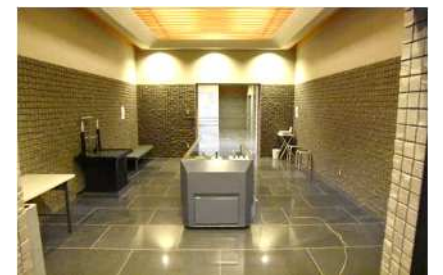
台車収骨方式の例(白根斎場)