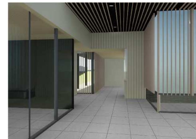
エントランスホールから待合室方向