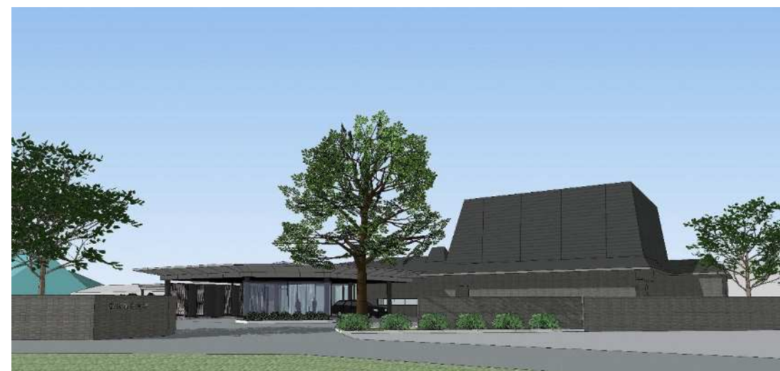
建物外観イメージ