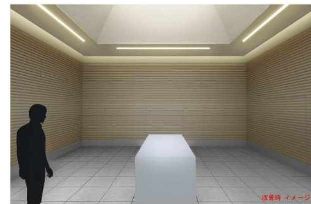
炉前ホール内部（告別及び収骨スペース）