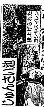
じゅんざい池 積上げられた コンクリート

豪雨対策強化を9月議会一般質問で 8月4日朝の集中豪雨は新 潟市では、東区を中心に大き な被害を受けた▼今後、想定 の倍を超える時間100ミリ以 上の降雨の頻発が予想され る。豪雨災害対策の強化が必 要。また度々水害に襲われる 山の下山場通、中野山8、新 石山4、竹尾2、河渡2等での 一歩踏込んだ対策。生活再 建に追われる罹災者にアン ソップ相談、支援窓口の設置 を9月議会で市長に求めた。