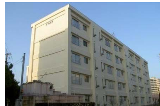
②公営住宅等ストック総合改善事業 (外壁改修工事)