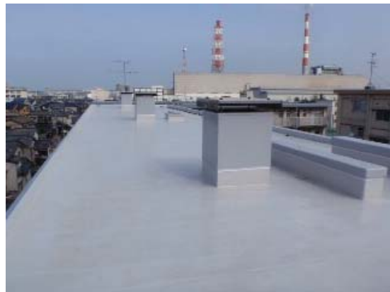
②公営住宅等ストック総合改善事業 (防水改修工事)