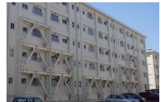
④住宅・建築物安全ストック形成事業 (耐震改修工事)