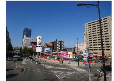
④優良建築物等整備事業 新潟駅南口西地区（建設予定箇所）