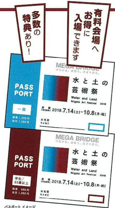
パスポートイメージ

※中学生以下、身体障害者手帳、療育手帳、精神障害者保健福祉手帳のいずれかを提示した方及び介助者1名は無料