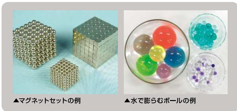
▲マグネットセットの例