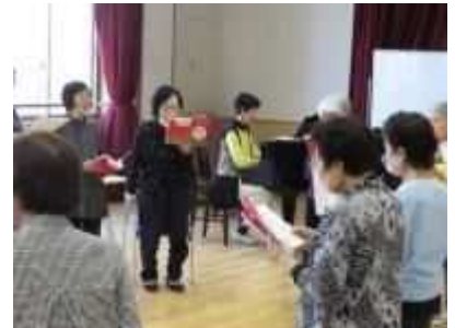
⑥「文化協会サークル育成事業」 5月17日(金)他、「歌いません科」、「パソコンあいく〜る」の体験会を行いました。