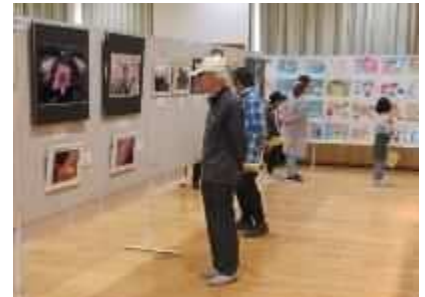
⑱「小須戸地区市民展」 10月26日(土)、27日(日)、小須戸地区の住民による作品展示。