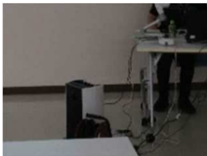
⑪「家庭教育講演会」 7月13日(土)、オンライン講座を保育付きで開催しました。