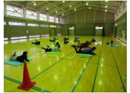
⑰シニアライフ講座(運動講座) 11/26,12/3,10 効果的なウォーキング