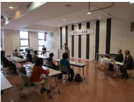
㉕文芸あきは表彰式 11/17 受賞者表彰と 各部門選考委員による講評