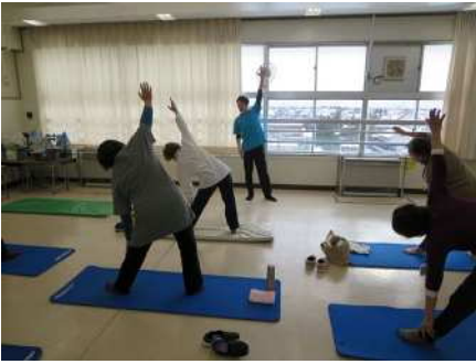
③地域交流事業(結小学校) 2/20 かんたんセルフケア&やさしいヨーガ