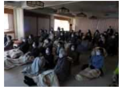
⑫「リバーサイドシネマ」 高齢者が元気で社会と関わりをもてるよう、老人福祉センターで映画を上映しています。