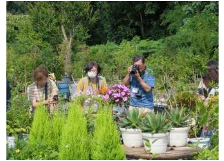
㉑写真撮影入門講座 7/5,12,23 県立植物園等を会場に写真撮影技術を学ぶ