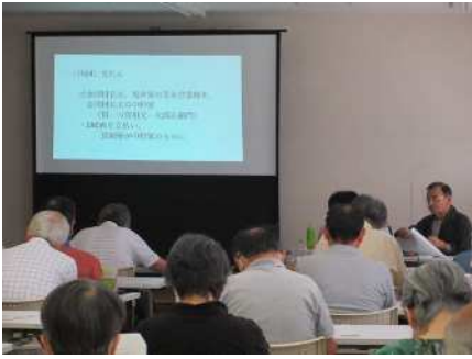
⑱秋葉区の学び 9/20~10/11 石油のまち 新津を学び、絵図や写真で理解を深める