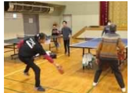
⑨「体験！ニュースポーツ入門」 1月25日(土)、モルック、スリッパ卓球などのニュースポーツの体験会を実施。