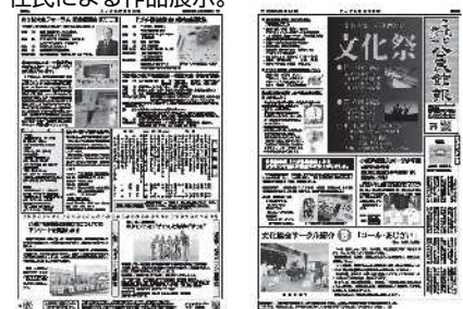
㉑「こすど地区公民館報の発行」 毎月15日発行。地域の話や公民館事業などの情報を紹介しています。