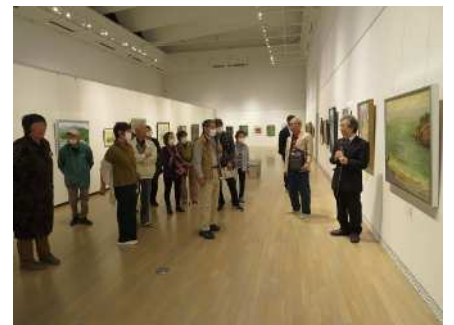
㉗秋葉区美術展覧会 10/26~11/4 区内高 校への働きかけにより高校生10名から出品