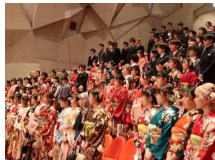
㉖秋葉区二十歳のつどい 5/3 5年ぶりに 一部制で開催、文化会館に多くの若者が集う