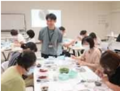
④「苔テラリウムを飾ろう！」 9月8日(日)、苔テラリウムを作成し、写真映えのする構図を教えてくださいました。