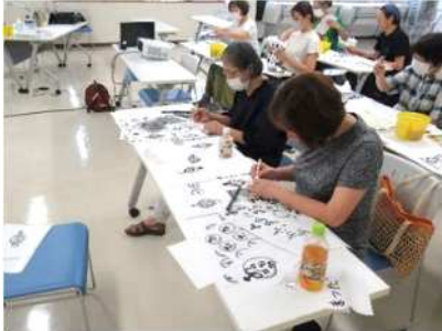
⑬「己書体験幸座」 5月15日(水)、7月17日(水)、8月7日(水)、3回コースの己書体験幸座を実施。