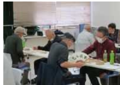
⑲「小須戸地区囲碁・将棋大会」 11月3日(日)、参加者の技術向上と交流を促進。