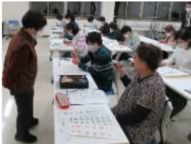
⑯「プチ書道教室」 11月15日(金)、24日(金)、宛名書き、暮らしに役立つ書を学ぶ。