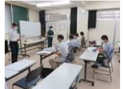
⑮「新津南高等学校開放講座」 9月7日(土)、9月28日(土)、11月16日(土)、現役の教師による講義を受ける。