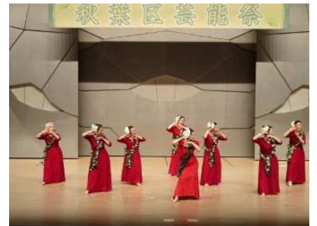
㉔秋葉区芸能祭 6/23 古典芸能からフラダ ンスまで、秋葉区の芸能の祭典