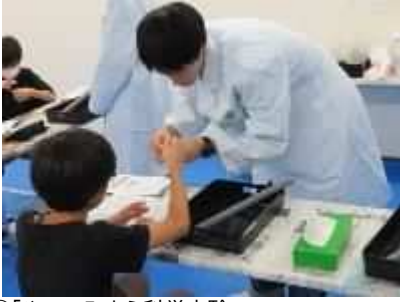
⑩「やってみよう科学実験」 8月20日(火)、新潟薬科大学の先生・生徒から、スライム、葉脈標本づくりなどを教わる。