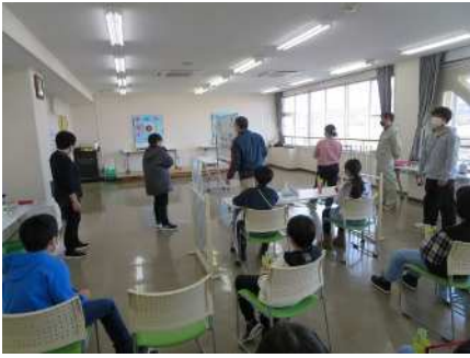
⑮こども創造塾(阿賀小学校キッズクラブ) 12/23 吹き矢体験