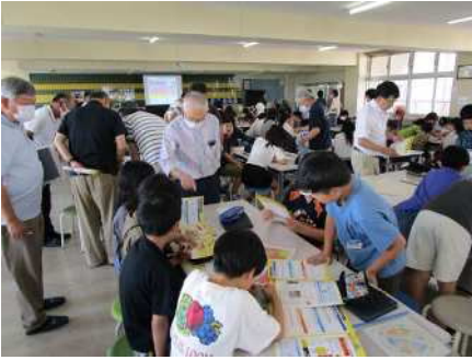
②コミュニティ防災学習会(阿賀小学校)6/15 コミ協と一緒に災害時の行動を考える