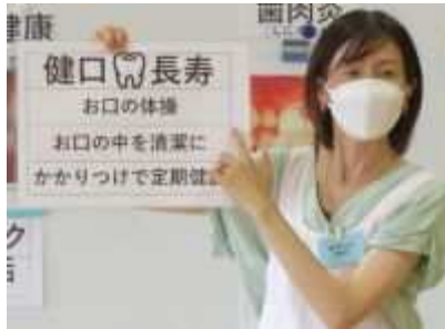
⑰「健康教室」 7月22日(月)、9月11日(水)に秋葉区健康福祉課と共催で健康教室を開催。