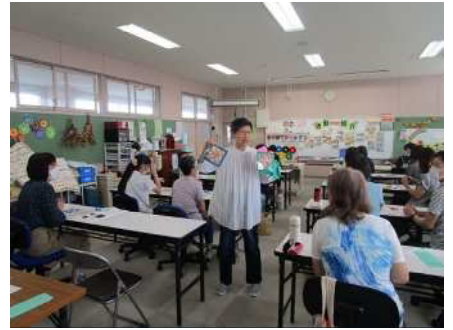
④地域と学校パートナーシップ事業(新津第三小学校)7/11 折り紙でかべかざり作り