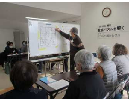
⑤地域と学校パートナーシップ事業(新津第一中学校)11/22,29,12/13 数字パズル解き