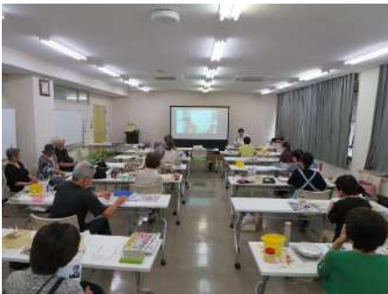
㉒日本画の描き方 7/28 箔の貼り方を実践 型講義で学ぶ