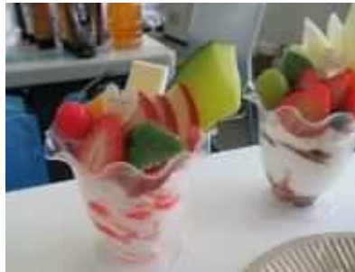
⑪「食品サンプルを作ろう！」 8月31日(日)、3部に分け、あざらし白玉かき氷、エビフライ、フルーツパフェを製作。