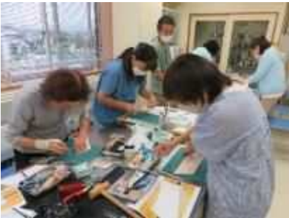
⑦「はじめてのレザークラフト体験会」 10月19日(土)、革を使った三角コインケースを制作。