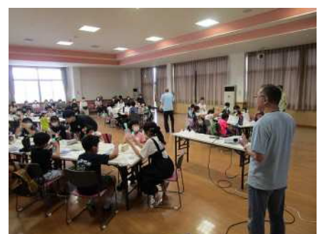
⑭アキハの宝こども探検ツアー 7/20 アメダ ス近くの小合コミセンで気象予報士から学ぶ