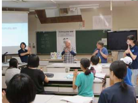
③地域交流事業(金津中学校) 8/2,7,21 中学生と地域の人が手話を勉強しながら交流