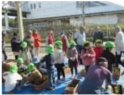
②「花いっぱい運動」 6月21日(金)、11月10日(金)、11月27日(水)矢代田駅西口等で花植えを実施