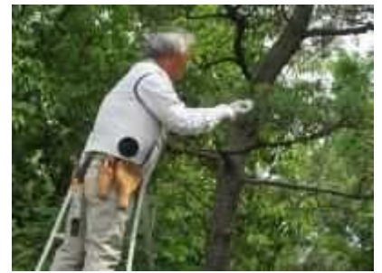
③「庭木剪定講習会」 6月22日(土)、クロマツ剪定のと病害虫の予防対策などの講習会を行いました。