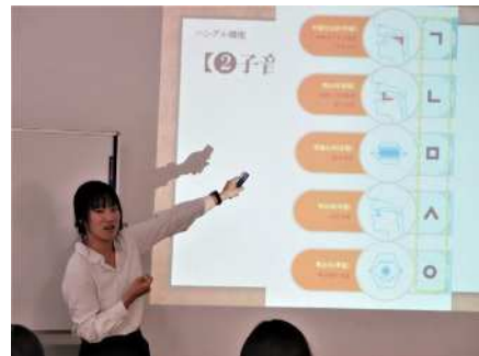
㉓はじめてのハングル 2/22 ハングルの特 徴や母音・子音の構成を学ぶ(初心者向け)