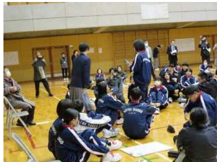
⑥GIP 集会(新津第五中学校) 11/22 テーマ「かげぐち」生徒会主体の運営に地域が参加