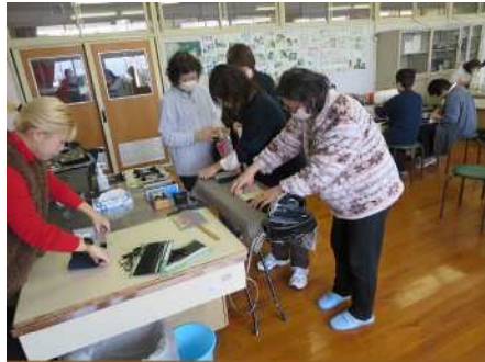
③地域交流事業(小合東小学校) 1/31 はぎれを使ったおしゃれなスマホ入れ作り