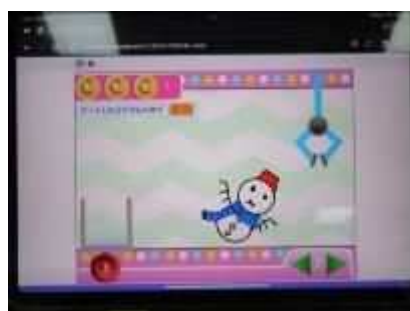
⑭「こどもプログラミング教室」 8月4日(日)、プログラミングツールを使ってクレーンゲームを制作。