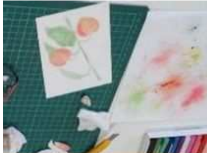
⑤「楽しい いろえんぴつとパステル」 9月11日(水)、9月25日(水)、色鉛筆とパステルで着彩体験。