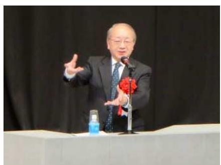
⑬あきは未来フォーラム 11/9 「認め合い、 共生できる社会」をテーマに関係団体と共催