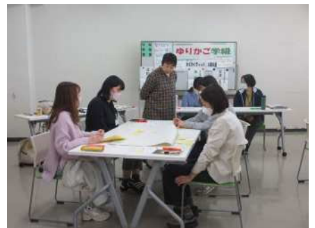
⑦ゆりかご学級 9~10月、2~3月(各4回) 子育て(乳児期)の学びと仲間づくり