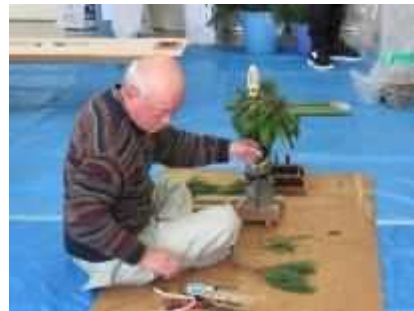
⑧「ミニ門松づくり」 12月14日(土)、子どもと保護者でミニ門松づくりを実施。