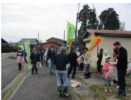
⑫秋葉区一斉クリーン作戦 4/21 6,960 人 が参加し、環境美化活動と世代間の交流