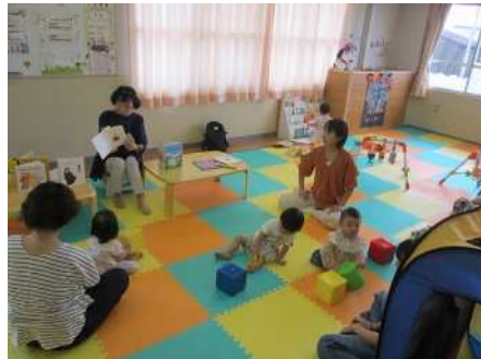
⑩子育てサロン「ポップー」 第1・第3 木曜日 こどもと保護者の交流の場(イベントあり)