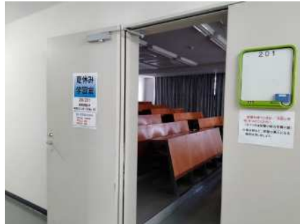
⑯学習室開放(夏休み夏休み) 201 研修室を こどもや若者の学習スペースとして開放