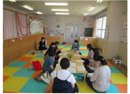
⑪保育者交流会 6/13 保育室を安心安全に 運営するため、保育者と職員で意見交換