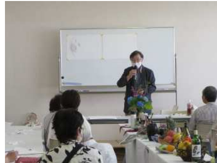
⑳洋画デッサン教室 6/16 卓上静物デッサン(鉛筆)