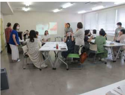
⑧ほかほか学級 7/10,9/12 幼児の食事や はぐくみについて学び、不安や悩みを共有