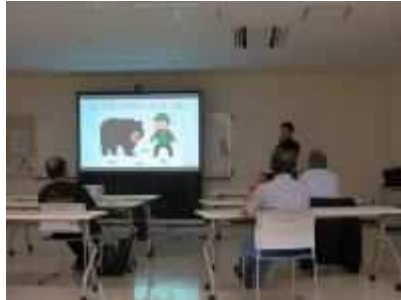
⑭「身近な害獣」講演会 6月14日(金)、クマ、イノシシなどの対処法などを学ぶ、身近な害獣講演会を開催。