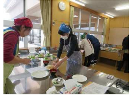
③地域交流事業(新関小学校) 12/25 新関で育った里芋の調理体験