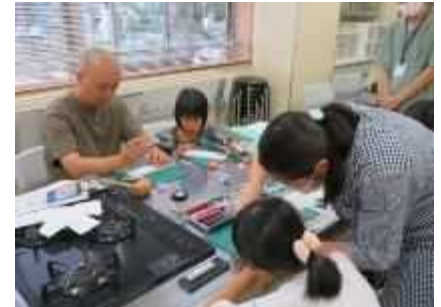
⑫「親子レザークラフト体験会」 10月19日(土)、親子で革のコインケースを製作。