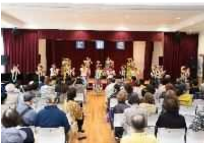
⑳「小須戸地区芸能祭」 11月12日(日)小須戸地区の住民による芸能発表会。