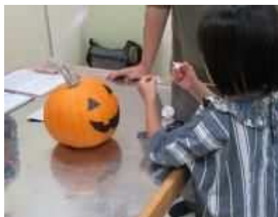
⑬「ハロウィン読み聞かせ&カボチャランタンづくり」10月19日(土)、親子でハロウィンのお話を聞き、カボチャランタンを製作。