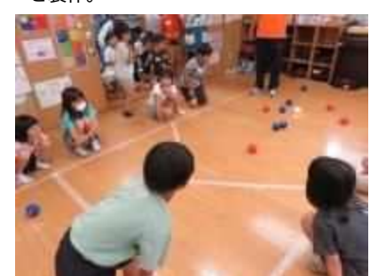
⑮「夏に負けないスポーツ体験」 8月8日(木)、小須戸ひまわりクラブで8チームによるポッチャの大会を実施。