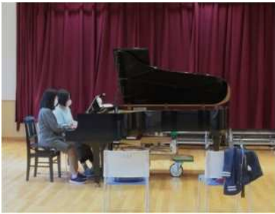
①「まちセンだれでもピアノ」 4月16日(火)、21日(日)、小須戸まちづくりセンターでグランドピアノを一般開放。