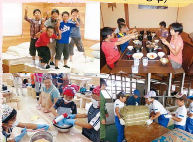
体験を通した仲間作り