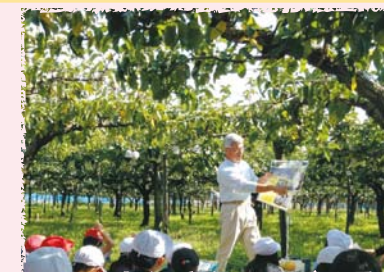
果樹農家でも学習