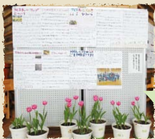
いくとぴあ食花でPR